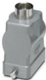
HEAVYCON sleeve housing B10, for single locking latch, height 72 mm, with support 1x M32, straight conductor exit

Please be informed that the data shown in this PDF Document is generated from our Online Catalog. Please find the complete data in the user's documentation. Our General Terms of Use for Downloads are valid ( http://phoenixcontact.com/download )