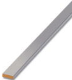
PEN conductor busbar, 3x10 mm, length: 2000 mm

Please be informed that the data shown in this PDF Document is generated from our Online Catalog. Please find the complete data in the user's documentation. Our General Terms of Use for Downloads are valid ( http://download.phoenixcontact.com )