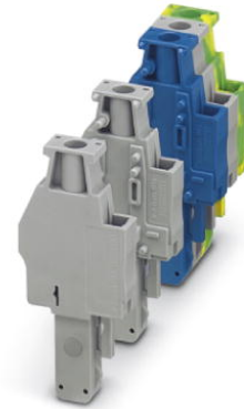
Illustration shows various versions of the product (left, center and right element) in different color combinations

http://eshop.phoenixcontact.de/phoenix/treeViewClick.do?UID=3045774