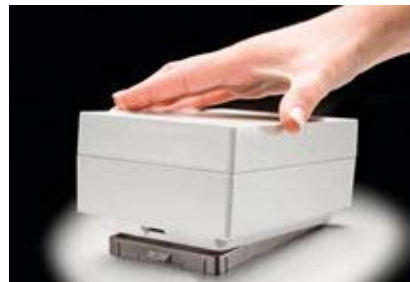
click to enlarge

Path: Home > Enclosure Index > ROLEC-HAMMOND Aluminum Product Index > R240 Series