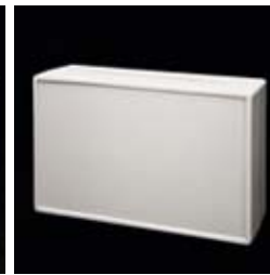
The entire front can be used for mounting keypads, switches, displays etc.