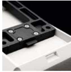
A recess on the bottom of the enclosure locates the snap-on device (invisible from the front)