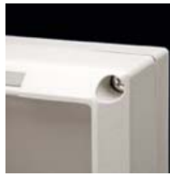
The lid fastening screws are located on the backside of the base