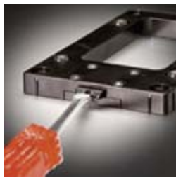
Snap-on device with spring loaded latch