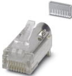
RJ45 pin insert, CAT5e, 8-pos., shielded, IDC connection method, for litz wires AWG 27 ... 26, with strain relief

Please be informed that the data shown in this PDF Document is generated from our Online Catalog. Please find the complete data in the user's documentation. Our General Terms of Use for Downloads are valid ( http://download.phoenixcontact.com )