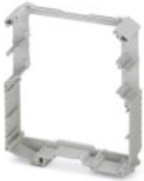
Complete housing, length: 99 mm, Central part, color: light gray, width: 45 mm

Please be informed that the data shown in this PDF Document is generated from our Online Catalog. Please find the complete data in the user's documentation. Our General Terms of Use for Downloads are valid ( http://phoenixcontact.com/download )