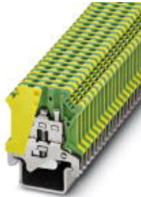
Ground modular terminal block, Connection method: Screw connection, Cross section: 0.2 mm 2 - 4 mm 2 , AWG 24 - 12, Width: 6.2 mm, Color: green-yellow, Mounting type: NS 35/15-2,3

Please be informed that the data shown in this PDF Document is generated from our Online Catalog. Please find the complete data in the user's documentation. Our General Terms of Use for Downloads are valid ( http://download.phoenixcontact.com )