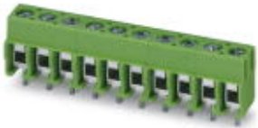
The figure shows a 10-position version of the product

PCB terminal block, nominal current: 17.5 A, nom. voltage: 400 V, pitch: 5 mm, number of positions: 4, connection method: Screw connection with wire protector, mounting: Wave soldering, conductor/PCB connection direction: 0 °, color: green