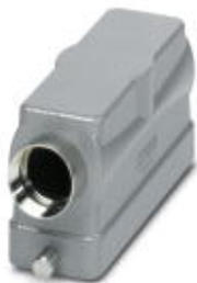
HEAVYCON B24 sleeve housing, for single locking latch, height: 65 mm, with 1 x M25 gland, lateral cable outlet

Please be informed that the data shown in this PDF Document is generated from our Online Catalog. Please find the complete data in the user's documentation. Our General Terms of Use for Downloads are valid ( http://phoenixcontact.com/download )