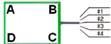
Origin (0,0) Point