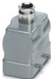
HEAVYCON B10 sleeve housing, for double locking latch, height: 56 mm, with 1 x M20 screw connection, straight cable outlet

Please be informed that the data shown in this PDF Document is generated from our Online Catalog. Please find the complete data in the user's documentation. Our General Terms of Use for Downloads are valid ( http://phoenixcontact.com/download )