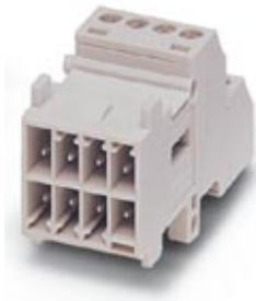
Contact insert module, for panel mounting frames, with screw connection, 7-pos. + PE connection, 160 V / 10 A

Please be informed that the data shown in this PDF Document is generated from our Online Catalog. Please find the complete data in the user's documentation. Our General Terms of Use for Downloads are valid ( http://download.phoenixcontact.com )