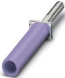
Female test connector, Color: violet

Please be informed that the data shown in this PDF Document is generated from our Online Catalog. Please find the complete data in the user's documentation. Our General Terms of Use for Downloads are valid ( http://download.phoenixcontact.com )