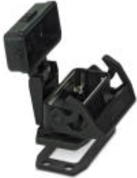
HEAVYCON EVO panel mounting base, plastic, D15, with single locking latch, with flat gasket, with protective cover

Please be informed that the data shown in this PDF Document is generated from our Online Catalog. Please find the complete data in the user's documentation. Our General Terms of Use for Downloads are valid ( http://phoenixcontact.com/download )