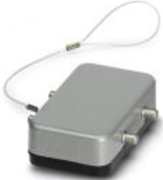
HEAVYCON protective cover, type B10, for sleeve housing with double locking latch, with retaining cord, IP65, ALU

Please be informed that the data shown in this PDF Document is generated from our Online Catalog. Please find the complete data in the user's documentation. Our General Terms of Use for Downloads are valid ( http://phoenixcontact.com/download )