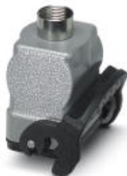
HEAVYCON coupling housing, with single locking latch, height: 77.5 mm, with 1 x M20 gland

Please be informed that the data shown in this PDF Document is generated from our Online Catalog. Please find the complete data in the user's documentation. Our General Terms of Use for Downloads are valid ( http://phoenixcontact.com/download )