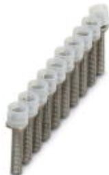
Bridge bar isolator, Number of positions: 10, Color: silver

Please be informed that the data shown in this PDF Document is generated from our Online Catalog. Please find the complete data in the user's documentation. Our General Terms of Use for Downloads are valid ( http://download.phoenixcontact.com )