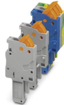
Illustration shows various versions of the product (left, center and right element) in different color combinations

http://eshop.phoenixcontact.de/phoenix/treeViewClick.do?UID=3051072