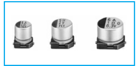
Marking color : Black print