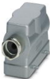
HEAVYCON B16 sleeve housing, for double locking latch, height: 76 mm, with 1 x Pg21 screw connection, lateral cable outlet

Please be informed that the data shown in this PDF Document is generated from our Online Catalog. Please find the complete data in the user's documentation. Our General Terms of Use for Downloads are valid ( http://phoenixcontact.com/download )