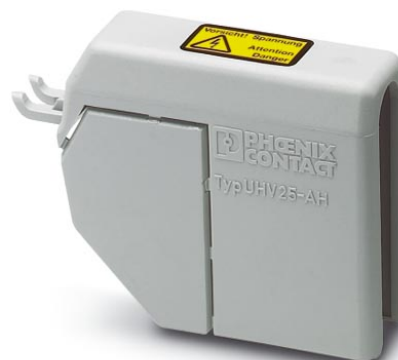
Illustration shows the product version UHV 25-AH

http://eshop.phoenixcontact.de/phoenix/treeViewClick.do?UID=2130460