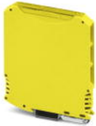
Complete housing, color: yellow

Please be informed that the data shown in this PDF Document is generated from our Online Catalog. Please find the complete data in the user's documentation. Our General Terms of Use for Downloads are valid ( http://phoenixcontact.com/download )