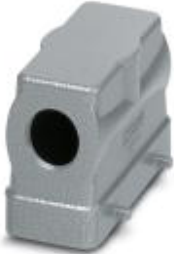
HEAVYCON B16 sleeve housing, for double locking latch, height: 65 mm, with 1 x M25 thread, lateral cable outlet

Please be informed that the data shown in this PDF Document is generated from our Online Catalog. Please find the complete data in the user's documentation. Our General Terms of Use for Downloads are valid ( http://phoenixcontact.com/download )