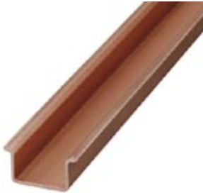
DIN rail, material: Copper, unperforated, 1.5 mm thick, height 15 mm, width 35 mm, length: 2 m

Please be informed that the data shown in this PDF Document is generated from our Online Catalog. Please find the complete data in the user's documentation. Our General Terms of Use for Downloads are valid ( http://download.phoenixcontact.com )