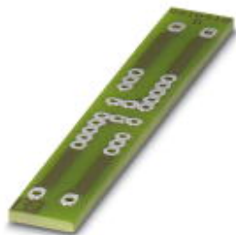
PCB for assembling electronic components

Please be informed that the data shown in this PDF Document is generated from our Online Catalog. Please find the complete data in the user's documentation. Our General Terms of Use for Downloads are valid ( http://phoenixcontact.com/download )