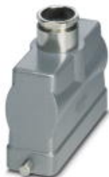
HEAVYCON B24 sleeve housing, for single locking latch, height: 76 mm, with 1 x Pg21 screw connection, straight cable outlet

Please be informed that the data shown in this PDF Document is generated from our Online Catalog. Please find the complete data in the user's documentation. Our General Terms of Use for Downloads are valid ( http://phoenixcontact.com/download )