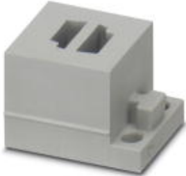
Small, slotted cable sleeves suitable for two AS-i cables, material: SEBS, version: left, left

Please be informed that the data shown in this PDF Document is generated from our Online Catalog. Please find the complete data in the user's documentation. Our General Terms of Use for Downloads are valid ( http://phoenixcontact.com/download )