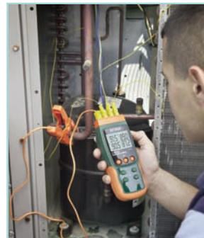
Simultaneously measures 4 temperature inputs for multiple source monitoring