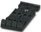
Strain relief, Number of positions: 4, Color: black