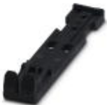
Strain relief, Number of positions: 2, Color: black