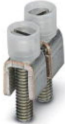
Fixed bridge, Number of positions: 2, Color: silver

Please be informed that the data shown in this PDF Document is generated from our Online Catalog. Please find the complete data in the user's documentation. Our General Terms of Use for Downloads are valid ( http://download.phoenixcontact.com )