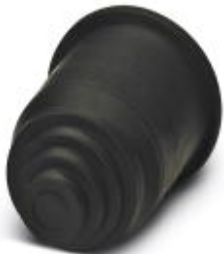
End sleeves, transition sleeves, from hose to cable

Please be informed that the data shown in this PDF Document is generated from our Online Catalog. Please find the complete data in the user's documentation. Our General Terms of Use for Downloads are valid ( http://phoenixcontact.com/download )