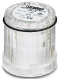
LED blinking light element, 24 V AC/DC, clear

Please be informed that the data shown in this PDF Document is generated from our Online Catalog. Please find the complete data in the user's documentation. Our General Terms of Use for Downloads are valid ( http://phoenixcontact.com/download )