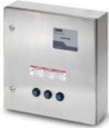
Indoor/outdoor lightning arrester and TVSS system for 277/480 V Wye system

Please be informed that the data shown in this PDF Document is generated from our Online Catalog. Please find the complete data in the user's documentation. Our General Terms of Use for Downloads are valid ( http://phoenixcontact.com/download )