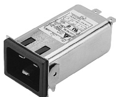
20GENG3E (Optional wire type)