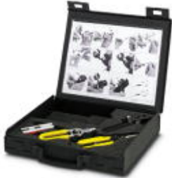
Tool set for PCF assembly, for 200/230 \mu\text{m} , 50/200/230 \mu\text{m} , and 62.5/200/230 \mu\text{m} PCF fibers

Please be informed that the data shown in this PDF Document is generated from our Online Catalog. Please find the complete data in the user's documentation. Our General Terms of Use for Downloads are valid ( http://phoenixcontact.com/download )