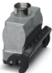
HEAVYCON B16 coupling housing, with single locking latch, height: 82 mm, with 1 x M32 gland, straight cable outlet

Please be informed that the data shown in this PDF Document is generated from our Online Catalog. Please find the complete data in the user's documentation. Our General Terms of Use for Downloads are valid ( http://phoenixcontact.com/download )