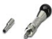
Contact removal tool for coaxial contacts