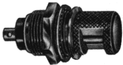
4-1930-2900-201 (without filter)