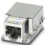
RJ45 socket insert, for the Freenet system, CAT5e, 8-pos., shielded, with cable connection (IDC fast connection), for solid wires AWG 24 ... 22

RJ45 female insert - VS-08-BU-RJ45-5-F/PK - 1652936