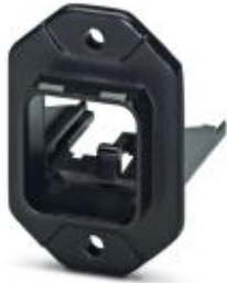
RJ45 panel mounting frame, IP67, for push-pull interlocking, plastic, with the Freenet system, for square panel cutout, with grommet, without mounting screws

Please be informed that the data shown in this PDF Document is generated from our Online Catalog. Please find the complete data in the user's documentation. Our General Terms of Use for Downloads are valid ( http://download.phoenixcontact.com )