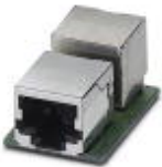
RJ45 socket insert, for the Freenet system, CAT5e, 8-pos., shielded, socket on socket

RJ45 female insert - VS-08-BU-RJ45-5-F/BU - 1652952