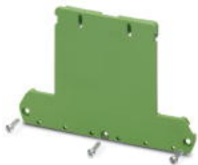
Side element, without foot, tall version, for 73 mm wide U-shaped cover.

Please be informed that the data shown in this PDF Document is generated from our Online Catalog. Please find the complete data in the user's documentation. Our General Terms of Use for Downloads are valid ( http://phoenixcontact.com/download )