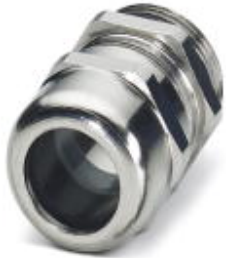
Cable gland, Cable gland material: Brass, nickel-plated, External cable diameter 19 mm ... 28 mm, Shielding: No, Connecting thread: M40, Color: silver

Please be informed that the data shown in this PDF Document is generated from our Online Catalog. Please find the complete data in the user's documentation. Our General Terms of Use for Downloads are valid ( http://phoenixcontact.com/download )