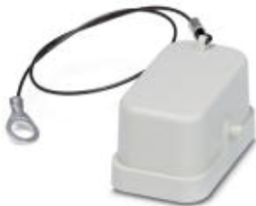
Protective cover for HC-COM-K housing... for female contact inserts

Please be informed that the data shown in this PDF Document is generated from our Online Catalog. Please find the complete data in the user's documentation. Our General Terms of Use for Downloads are valid ( http://download.phoenixcontact.com )