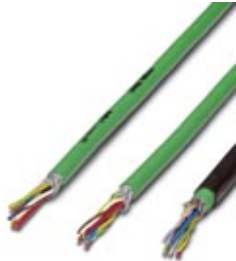
INTERBUS hybrid cable for the extended installation remote bus

Please be informed that the data shown in this PDF Document is generated from our Online Catalog. Please find the complete data in the user's documentation. Our General Terms of Use for Downloads are valid ( http://phoenixcontact.com/download )