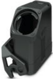
HEAVYCON EVO coupling housing, plastic, with bayonet flange for EVO screw connection, D25, with single locking latch, without EVO screw connection

Please be informed that the data shown in this PDF Document is generated from our Online Catalog. Please find the complete data in the user's documentation. Our General Terms of Use for Downloads are valid ( http://phoenixcontact.com/download )