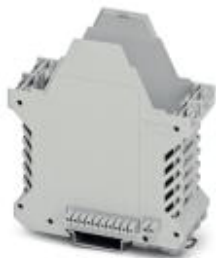
Component housing, length: 99 mm, color: light gray

Please be informed that the data shown in this PDF Document is generated from our Online Catalog. Please find the complete data in the user's documentation. Our General Terms of Use for Downloads are valid ( http://phoenixcontact.com/download )