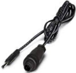
Cinch connecting cable, for addressing FLX ASI M12 devices

Please be informed that the data shown in this PDF Document is generated from our Online Catalog. Please find the complete data in the user's documentation. Our General Terms of Use for Downloads are valid ( http://phoenixcontact.com/download )