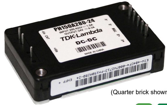
(Quarter brick shown)