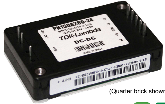
(Quarter brick shown)