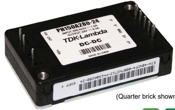
(Quarter brick shown)