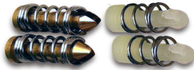
Push Pin Spring Kits